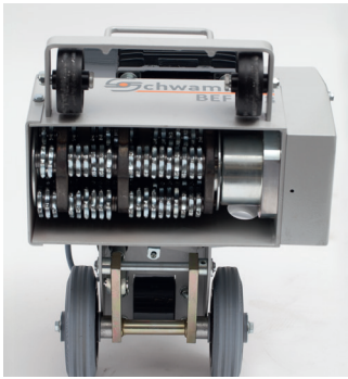
Serienmäßig mit integrierter Randfräse