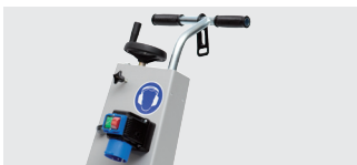
Einfach zu bedienen, sicher in der Anwendung