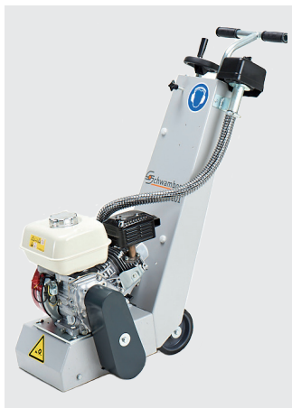
BEF 201 Benzin