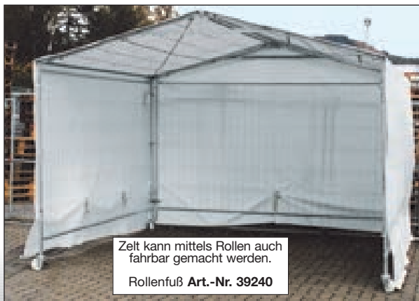
Zelt kann mittels Rollen auch fahrbar gemacht werden. Rollenfuß Art.-Nr. 39240